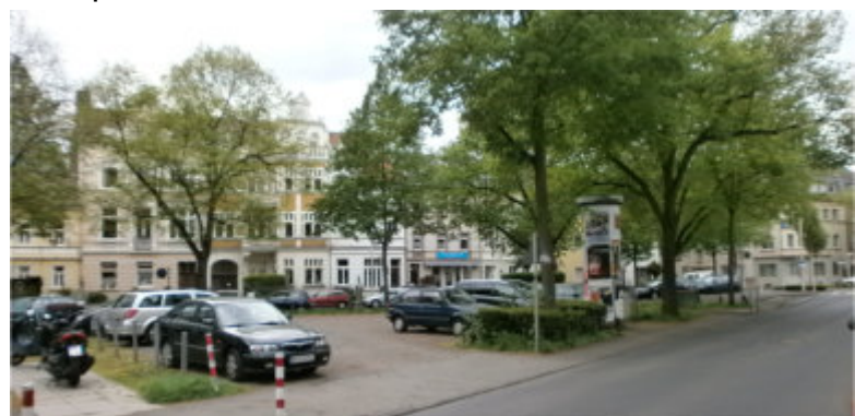
Der Markusplatz in Kessenich; wertvoller Baumbestand; Wohnen mit hoher Qualität; aber ein Platz, der schlecht gestaltet ist und nur als Parkplatz dient.

Anpacken statt Aussitzen - damit Kessenich weiter liebenswert bleibt!